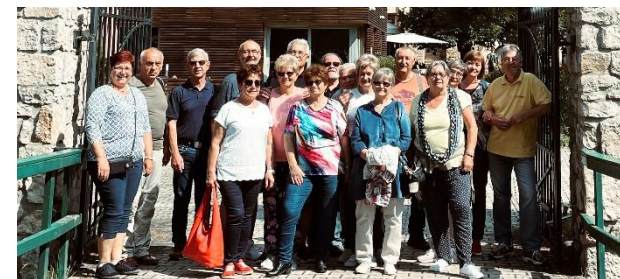
Treffen mit der PG aus Dombóvár mit Übergabe der Spenden

Anfang Juni 2023 war eine 7-köpfige Delegation unserer PG in Ungarn zwecks Übergabe von Sach- und Finanzspenden an unsere PG-Freunde von Dombóvár. Außerdem wurde eine mögliche Reise für eine Ungarnreise in 2024 eruiert.