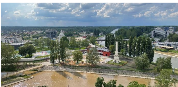
Győr, Stadt der Flüsse