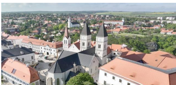
Veszprém, Europäische Kulturhauptstadt 2023