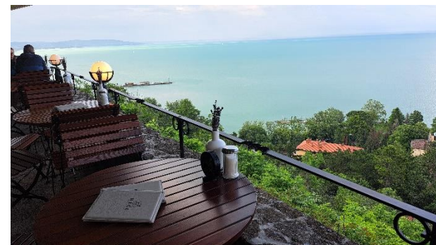
Tihany am Nordufer des Balatons mit der Abtei und dem Kaffee „Rege“ hoch über dem Balaton