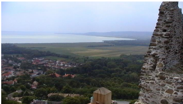
Aussicht von der Burg Szigliget auf den Balaton