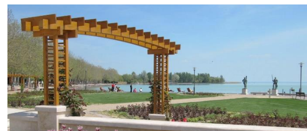
Balatonfüred am Nordufer des Balatons