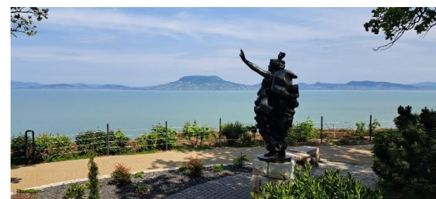
Fonyód am Südufer des Balatons